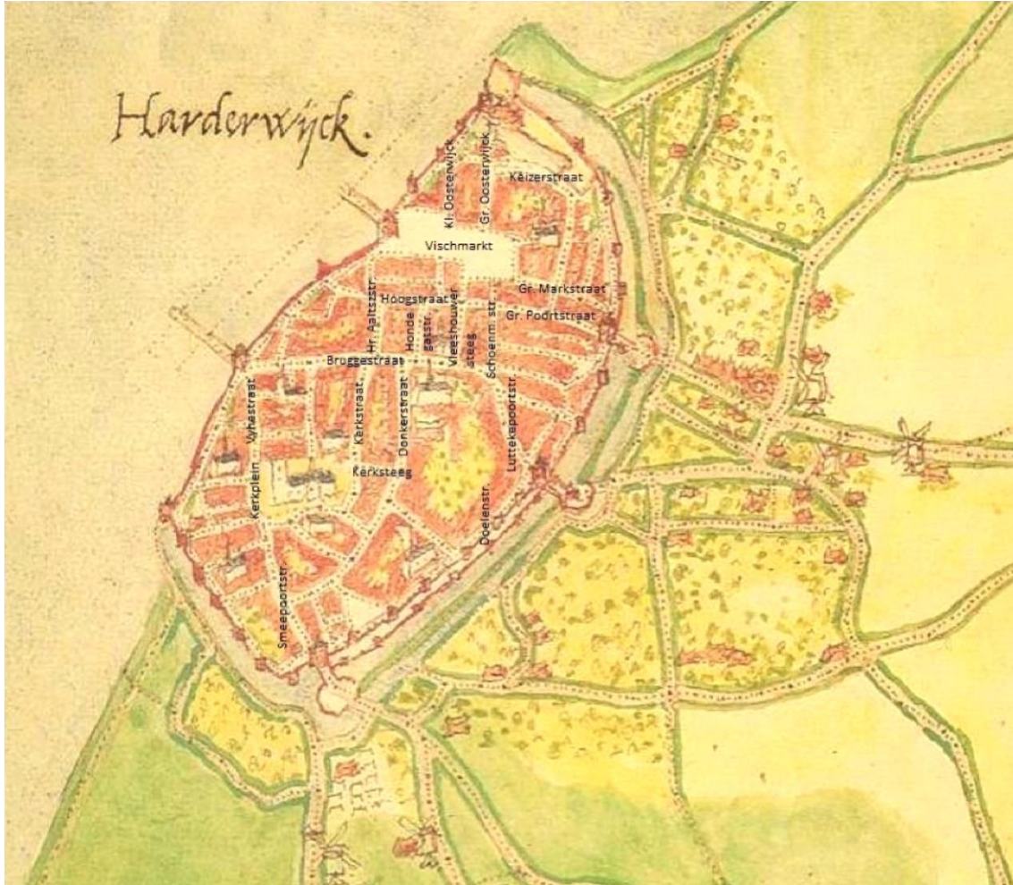
Figuur 2. Plattegrond Harderwijks oude centrum.

IIIb. Jacobgen Ryxen , keurmedig, overl. Harderwijk 1585, tr. verm. vóór 1550 Rijcket Rycksen (Rijket den Huisman), burger te Harderwijk, overl. vóór 16-10-1599, zn. van Ryck N.